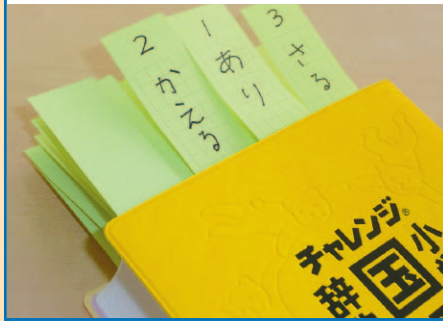
本ハンドブック内では、「チャレンジ 小学国語辞典 第四版」の写真を使用しているものもあります。

※ふせんは意外と費用がかかるかもしれませんが、「辞書引き学習」で子どもが得るものは、ふせん代以上の大きな財産になります。どんどん買い足していきます。